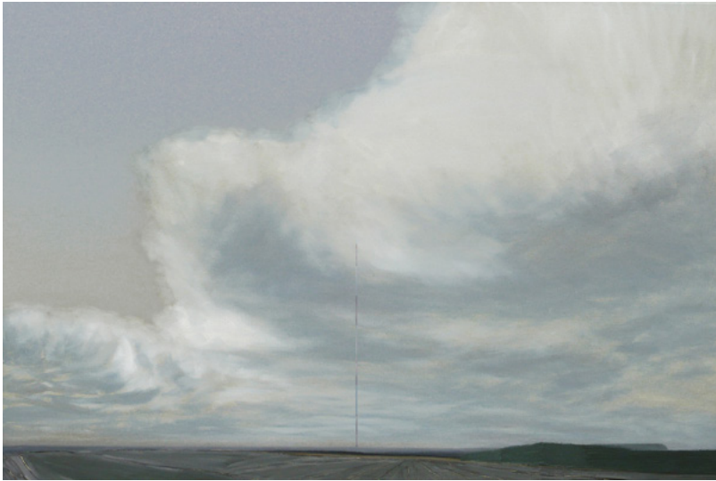
Michel Peetz, Lumière du Nord , 2017, peinture à l'huile, 60 x 90 cm

Les peintures de Michel Peetz explorent des champs ouverts, tournés vers l'océan, à perte de vue. Les paysages de bord de mer invitent à prendre la mesure de l'infini du ciel et de la terre, confrontés en miroir, séparés par le fil ténu de l'horizon. Alors que les sols semblent écrasés par la pesanteur, des acteurs vertigineux se déploient dans l'espace : les nuages. Ils animent la plus grande surface des toiles et amènent à la contemplation d'une immensité en perpétuel mouvement.