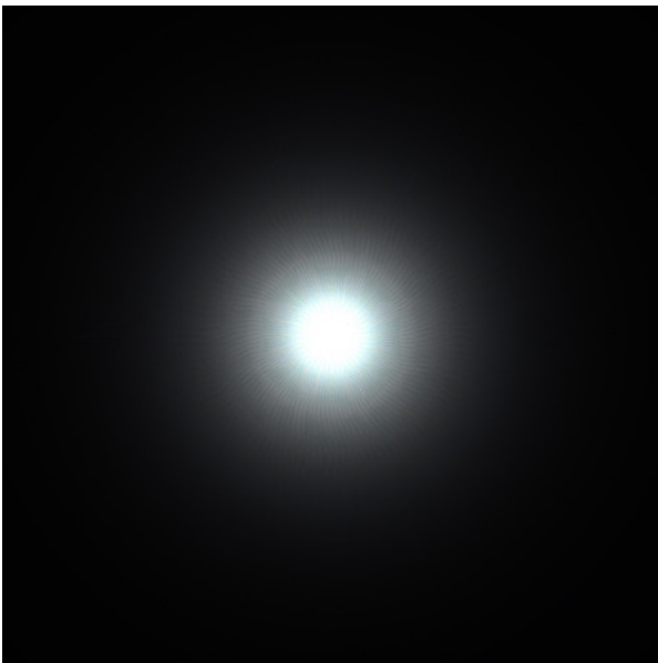
Michel Peetz, Cosmos , 2017, dessin numérique imprimé sur papier, 40 x 40 cm

Les peintures de Michel Peetz explorent des champs ouverts, tournés vers l'océan, à perte de vue. Les paysages de bord de mer invitent à prendre la mesure de l'infini du ciel et de la terre, confrontés en miroir, séparés par le fil ténu de l'horizon. Alors que les sols semblent écrasés par la pesanteur, des acteurs vertigineux se déploient dans l'espace : les nuages. Ils animent la plus grande surface des toiles et amènent à la contemplation d'une immensité en perpétuel mouvement.